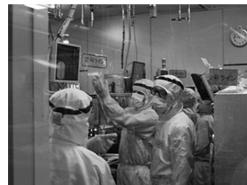
クリーンルームの製造現場で

実していますが、さらに保全技術や製造監督の改善スキルの向上などに、独自で取り組んでいます。